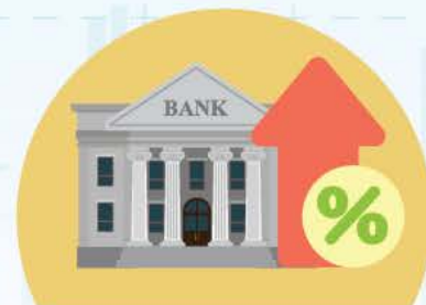
Aumento significativo das taxas de juro pelos principais bancos centrais do mundo

Em 2022, o mercado financeiro foi arrastado por vários factores negativos , com as acções e as obrigações internacionais a registarem simultaneamente retornos negativos significativos.